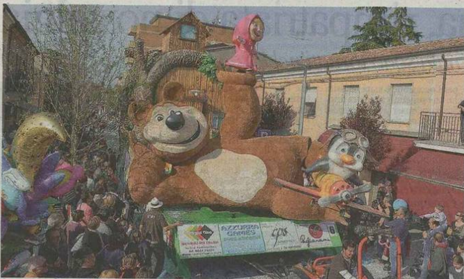
SPETTACOLO Il carro dedicato all'orso Masha dell'ultima edizione, ne verranno spiegati i meccanismi

LONGIANO si prepara alla annuale invasione dei Maggiolini Volkswagen in programma domenica. Sarà il ventiduesimo ritrovo, arriveranno Maggiolini, Maggiolini e derivati (Pescaccia, Buggy, Trike). L'anno scorso hanno partecipato un centinaio di esemplari.