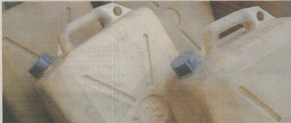
Adottava stratagemmi particolari per "spezzettare" l'azione delinquenziale e rischiare meno. L'altra notte all'ex Zuccherificio gli è andata male

Da tempo i poliziotti erano sulle sue tracce ma non riuscivano a pizzicarlo con le taniche in mano: operava con professionalità e grande abilità