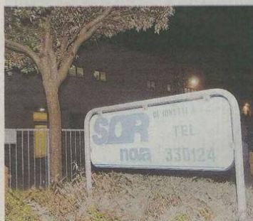
La Sor Nova di cui Spinella è stato amministratore

Si registrano nuove tentate truffe perpetrate da persone che si spacciano per dipendenti del Comune di Cesena. Anche ieri mattina, in zona Pievestina, due persone hanno suonato a casa di un'anziana signora e si sono qualificate come dipendenti comunali. I due hanno tentato di raggirare una signora novantenne, ma lei non ha aperto loro la porta e ha allertato la figlia che abita nella casa a fianco. La figlia dell'anziana ha verificato col Comune se effettivamente avessero mandato del personale a casa dell'anziana e dal Municipio hanno spiegato che non mandano dipendenti a casa della gente. Casi analoghi si erano già verificati durante il mese di luglio, con probabili truffatori che avevano girato varie zone della città presentandosi come incaricati del Comune, questi sedicenti rilevatori affermano di svolgere una indagini statistica porta a porta per conto del Comune. A questo proposito il Comune di Cesena avverte che, al momento, sono in corso solo rilevazioni all'interno degli uffici comunali e che nessun operatore è stato incaricato di effettuare ricerche statistiche porta a porta. Per questo si invitano i cittadini alla prudenza ed avvisare le forze dell'ordine nel caso ci si ritrovi questi "operatori" alla porta. Questi fenomeni si aggiungono ai venditori porta a porta di contratti per la luce elettrica, la telefonia o il gas, che accampano scuse e pretesti per farsi aprire, specialmente con gli anziani.