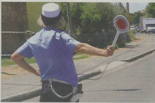
Foto generica di agente della Municipale che ferma le vetture per controlli