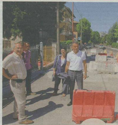
Sindaco e assessore davanti ai lavori della pista ciclabile lungo via Savio

Di fronte alle fermate bus, la pista ciclabile sarà rialzata per permettere l'attesa e la discesa dei passeggeri dai mezzi pubblici, dove sono presenti le isole ecologiche verrà allargato lo spartitraffico a 1,50/2,00 metri. Con l'intervento, la carreggiata verrà portata a costantemente a 7,50 nel primo tratto, mentre nel secondo tratto sarà di 8 metri. La rotonda prevista all'incrocio con via Ancona avrà un diametro di ml. 27,00 e sarà strutturata in una carreggiata di 8 metri, un anello diporfidato sormontabile di ml 2,00 e un anello centrale di diametro 7 metri; sul lato della Via Ancona sarà costruita la pista ciclabile di ml 2,50 mentre sul lato del giardino pubblico sarà realizzato un marciapiede da 1,50 che si andrà a collegare con quelli esistenti. I lavori, eseguiti dalla ditta Fabbri Costruzioni di San Leo, hanno un importo di 855mila euro, di cui 55mila finanziati dalla Regione.