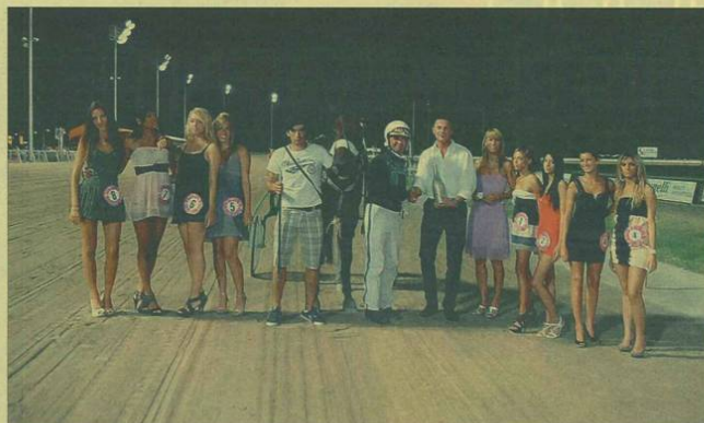
La premiazione del Premio Fiat Antonelli Gruppo Auto SAT 2010 assieme alle concorrenti di Lady Trotto (sotto una selezione)

via a testare, sia la nuova versione di Nacarat Dany che un chiacchierato trial di Nestella Gual, in caso contrario, spazio a Nice And Charming e Vecchione, coppia dal collaudato feeling ma con uno scomodo undici sul selino a limitarne le mosse.