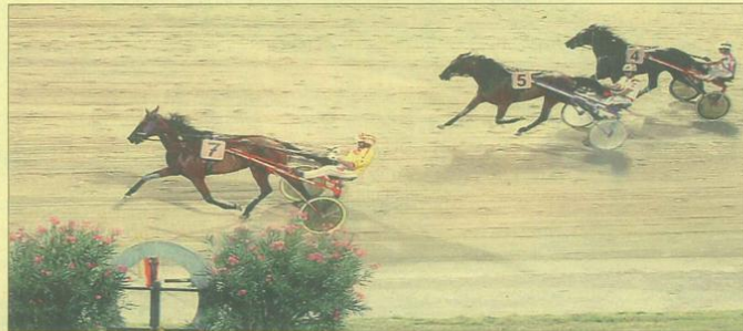
L'arrivo del Premio Orogel 2009