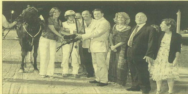
Il momento della della premiazione

Un alone di mistero ricoprirà i venerdì sera di luglio, agosto e settembre con nove serate dedicate al fantastico mondo dell'illusionismo, del circo e dell'arte di strada. Si alterneranno esibizioni di magia, giocoleria, faticismo, escapologia e tante altre discipline. Se amate il divertimento, l'adrenalina e la suspense non potete assolutamente mancare all'appuntamento. Questa sera sarà il MAGO WALTER ad inaugurare le notti magiche del Savio. Immaginate di mischiare magia, divertimento, cabaret, professionalità ed improvvisazione. Il risultato? Uno spettacolo fuori dagli schemi, che vi sorprenderà per la sua spontaneità e l'attenta cura del dettaglio; uno show unico nel suo genere, che saprà emozionarvi, divertirvi e che vi farà condividere con chi vorrete l'esperienza magicomica nel fantastico mondo del giullare della magia Walter Klinkon.