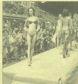
Un momento della sfilata di moda nel parterre dell'ippodromo del Savio