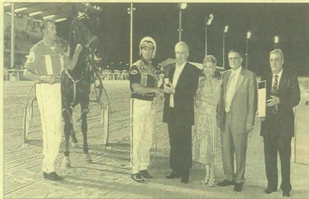
La premiazione della corsa centrale (sesta) Premio Cassa di Risparmio di Cesena