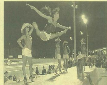
Le acrobazie della protagoniste del balletto durante la serata Fotoservizio Calbucci